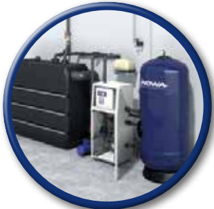
WATERTEC® WT 6